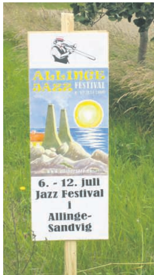
Der reklameres for Allinge Jazz Festival-uge.

uden at de har været forelagt brugerrådet. Flere medlemmer af brugerrådet føler sig direkte til grin, og i øjeblikket overvejer de lokale repræsentanter, om de vil fortsætte i brugerrådet, skriver byforeningen.