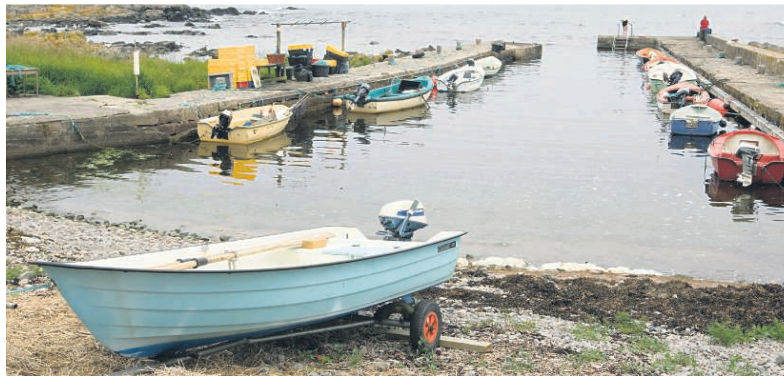
Havnen i BølsHAVN bliver fremtidssikret med midler fra kommunen og EU.

Årets jazzfestival fra 6. til 12. juli bliver den 11. i rækken af traditionelle jazz-festivaler på Nordbornholm – »Toppen af Bornholm«. I år præsenteres 12 bands fra Tyskland, Sverige, Holland og Danmark, og der bliver i alt spillet 40 koncerter rundt omkring i Allinge og Sandvig, på scenen og på restauranter. Herunder arrangeres tirsdag aften to kirkekoncerter og onsdag aften en solnedgangsfejrtur rundt om Hammerknuden eller ned langs østkysten – alt efter vejrforholdene – med M/S Ertholm. De medvirkende orkestre er Björn Ingelstam Band, Sverige og Danmark, Burgundia Jazzband, Bornholm, Doghousecats, Danmark, Goosetown Jazzband, Danmark, Jazz Five, Danmark, Max Lager's New Orleans Stompers, Sverige, New Orleans Delight, Danmark, Sverige og Storbritanien, Revival Jassband, Holland, River Jazz & Blues Band, Danmark, Second Line Jazzband, Sverige, Sir Gusche Band, Tyskland og Swinging Feetwarmers Jazzband, Tyskland og Danmark.