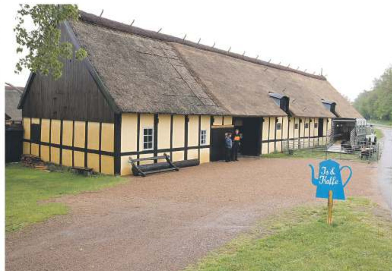
Damaskegård lå i nærheden af Melstedgård, der i 1985 åbnede som Bornholms landbrugsmuseum i 1985.