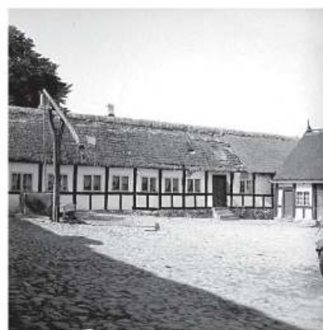
Scenen til teaterforestillingen »Pelle Erobreren« på Frilandsmuseet kan næppe være mere bornholmsk, idet den udgøres af Damaskegård (billedet herover) fra Melsted.